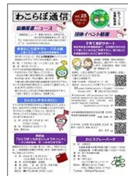
← センター発行 「わこらぼ通信」